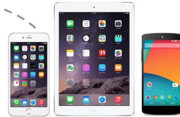
紛失したデバイス