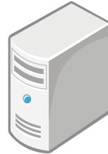
デバイスマネジメントサーバ